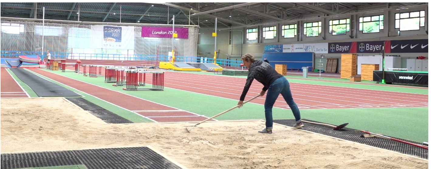
Abb. 9.14 Regelmäßiges Harken der Sandgrube sichert eine unfallfreie Landung

Die Auflistung verdeutlicht, in wie vielen Bereichen sich der Trainer auskennen und aktiv werden muss, um seinem Kerngeschäft „Training und Wettkampf“ nachzukommen. Bei knapper Zeit